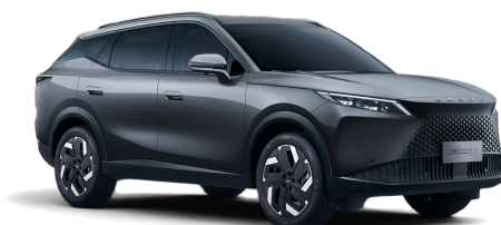
Matte Gray 1 300 €