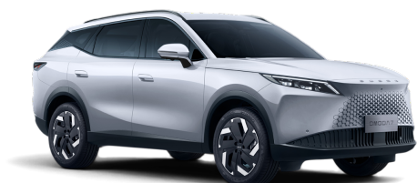
Khaki White 0 €