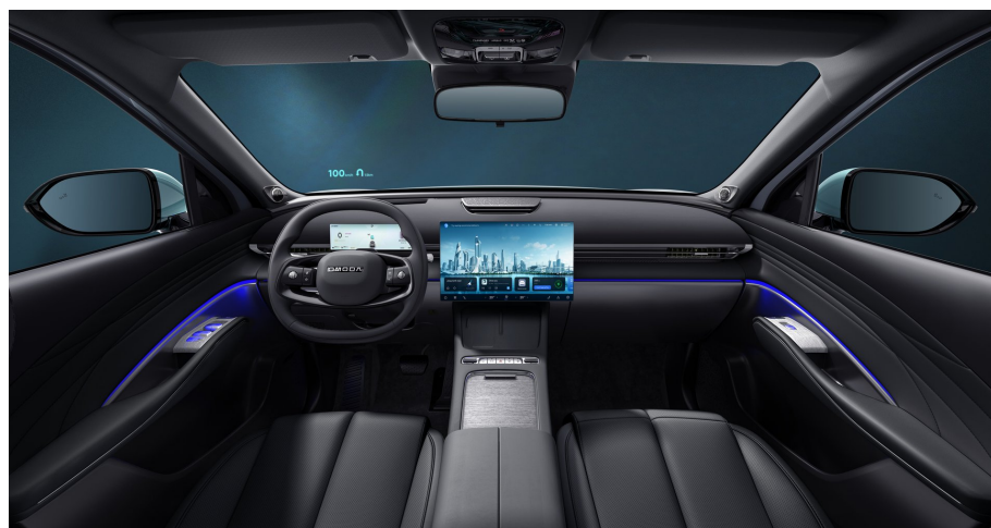
Čierny interiér 0 €