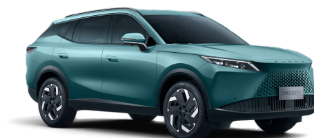
Misty Green 800 €