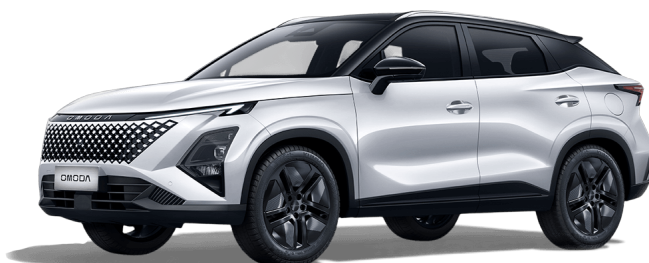
Khaki biela a Čierny top 700 €