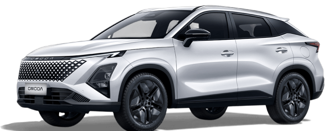
Khaki biela 400 €