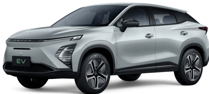
Kovovo strieborná 400 €