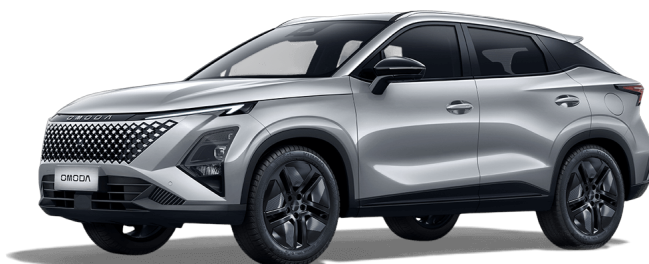
Kovovo strieborná 400 €