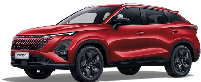
Krvavo červená 0 €