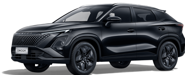
Uhlíkově čierna 400 €