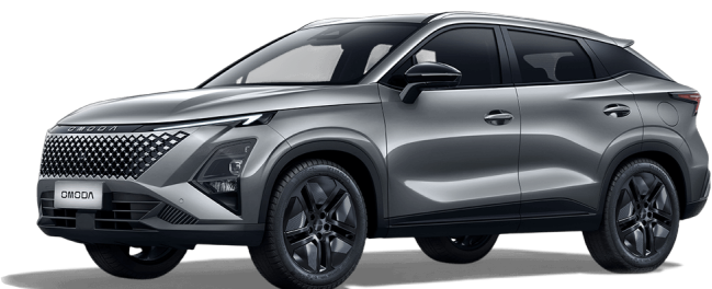
Fantómovo sivá 400 €