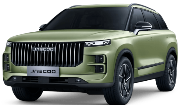
Vodná zelená 500 €