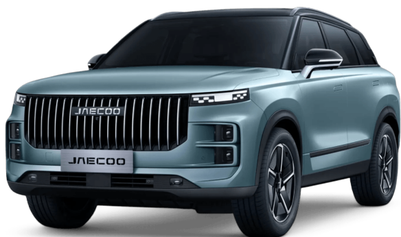
Olivovo šedá Čierny top 800 €