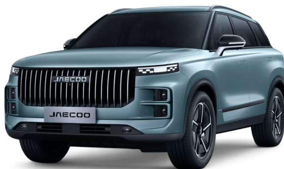
Olivovo šedá 500 €