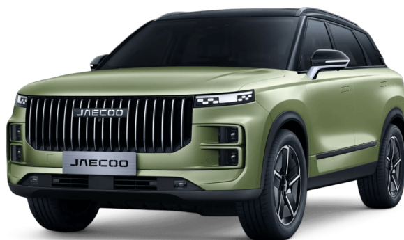
Vodná zelená Čierny top 800 €