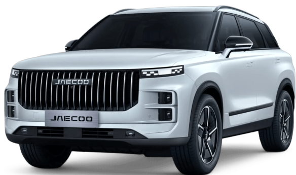
Khaki biela 0 €