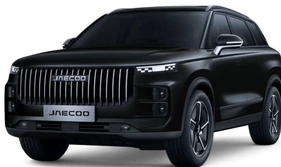
Uhlíkovo čierna 500 €