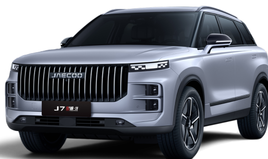
Strieborná 500 €