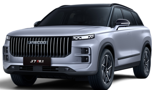
Čierna a Strieborná 800 €