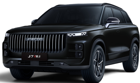
Čierna 500 €