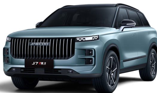
Čierna a Šedá 800 €