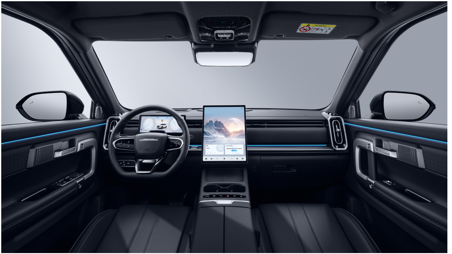
Čierny interiér 0 €